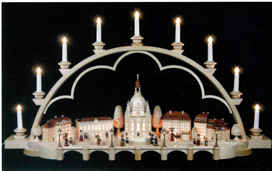
Strahlend: der elektrische Siebener-Lichterbogen „Altes Dresden“

Fotos: Kleinkunst aus dem Erzgebirge © Mueller