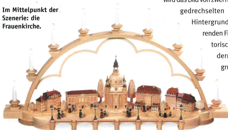
Im Mittelpunkt der Szenerie: die Frauenkirche.

Ein ganz besonderes Kleinod bietet Kleinkunst aus dem Erzgebirge® Mueller mit seinem kunstvollen Schwibbogen „Altes Dresden“. Diese Reminiszenz an die Zeiten von Glanz und Gloria, an wundervoll Barockes ist ein echtes Sammlerstück aus Holz von außerordentlicher Qualität.