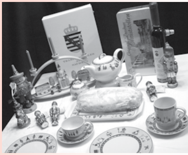
Traditionelles für die Weihnachtszeit 2009

Porzellan mit erzgebirgischem Dekor, Schwibbogen und Räucherfigur aus Seiffen sowie Christbaumschmuck aus Lauschaer Glas stehen auf dieser festlichen Tafel. Bei Original Dresdner Christstollen®, Dresdner Stollenlikör und Nürnberger Lebkuchen läuft den Gästen das Wasser im Mund zusammen.